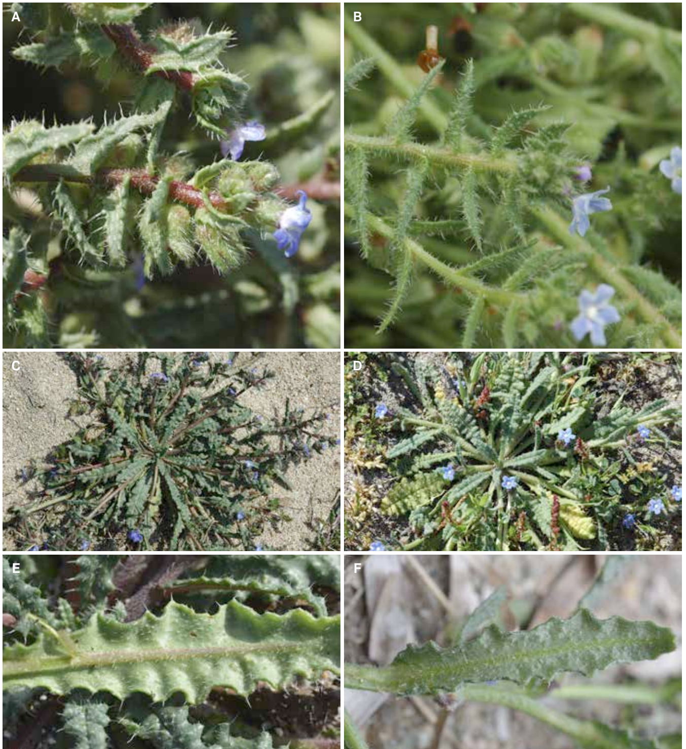
Fig. 2. – Tiges florifères (A, B), individus fleuris (C, D) et face inférieure d'une feuille (E, F). A. Anchusa crispa subsp. valincoana Paradis, Piazza & Quilichini; B. Anchusa crispa Viv. subsp. crispa ; C. Anchusa crispa subsp. valincoana ; D. Anchusa crispa subsp. crispa ; E. Anchusa crispa subsp. valincoana ; F. Anchusa crispa subsp. crispa .